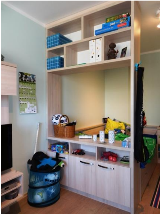
Spokojený Jonášek v novém pokojíčku: