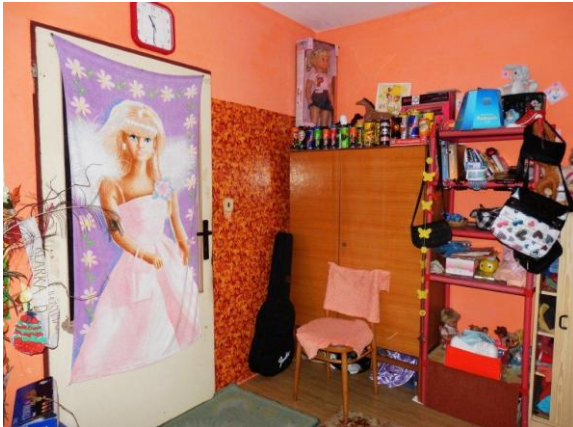
Pokojíček před proměnou: